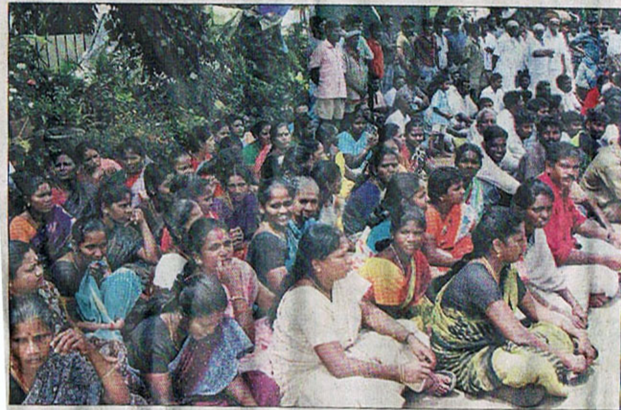
கோவில்பட்டியில் பள்ளி சிறுமியை பாடலில் பலாத்காரம் செய்தவரை குண்டர் தடுப்பு சட்டத்தில் கைது செய்யக்கோரி சுப்பிரமணியபுரம், ஸ்டாலின் காலனியைச் சேர்ந்த 500க்கும் மேற்பட்டோர் ஆர்.டி.ஓ. அலுவலகம் முன்பு முற்றுகை போராட்டத்தில் ஈடுபட்டனர்.